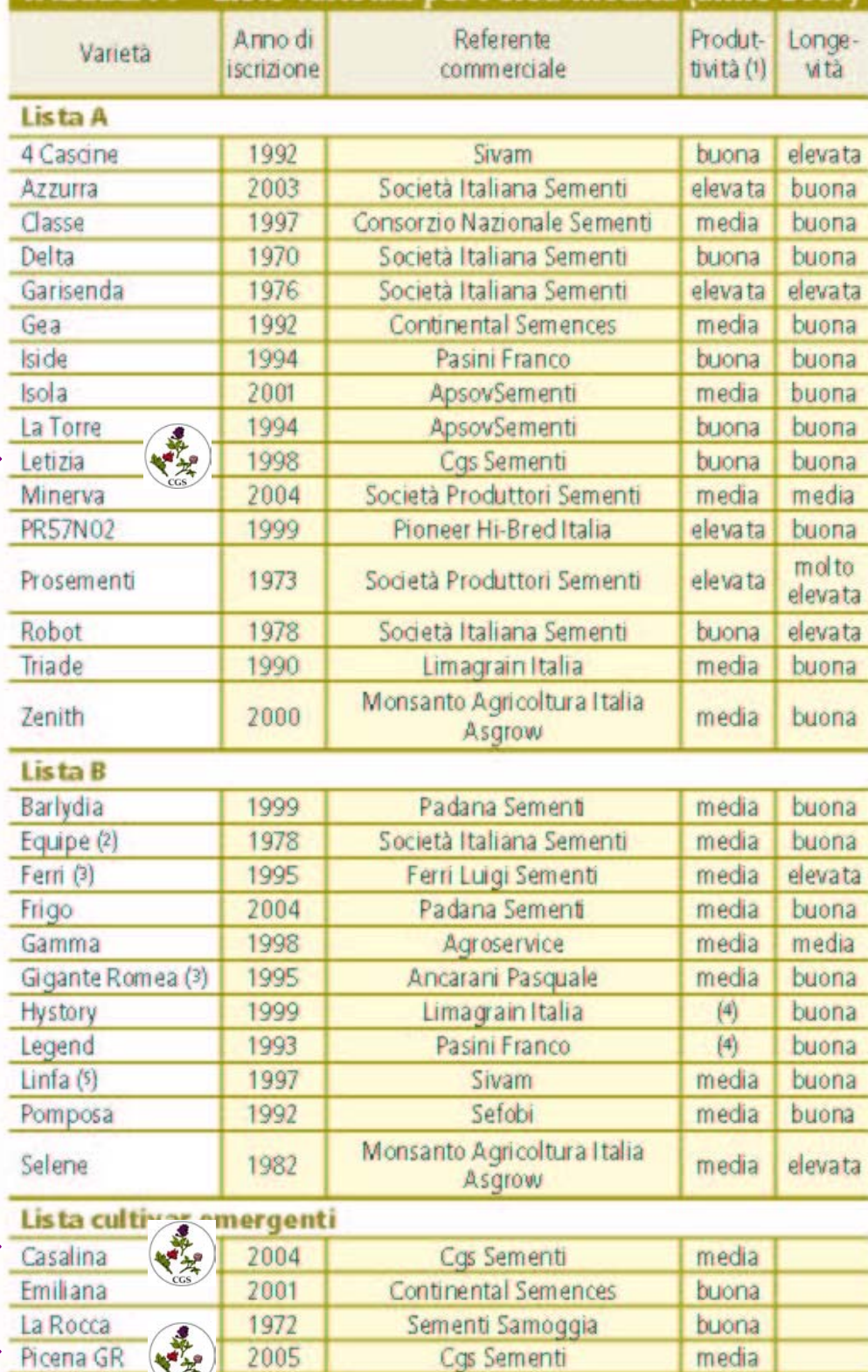
TABELLA 7 - Liste varietali per l'erba medica (anno 2007)

(1) La produttività viene determinata secondo i seguenti livelli produttivi espressi in percentuale sull'indice medio generale (IMG): IMG 101-103 = media; IMG 104-106 = buona; IMG > 107 = elevata. (2) Consigliata nella pianura occidentale della regione Emilia-Romagna. (3) Scarso adattamento ai terreni sub-acidi. (4) Resa inferiore alla media; varietà multifogliata. (5) Buon adattamento ai terreni sub-acidi.